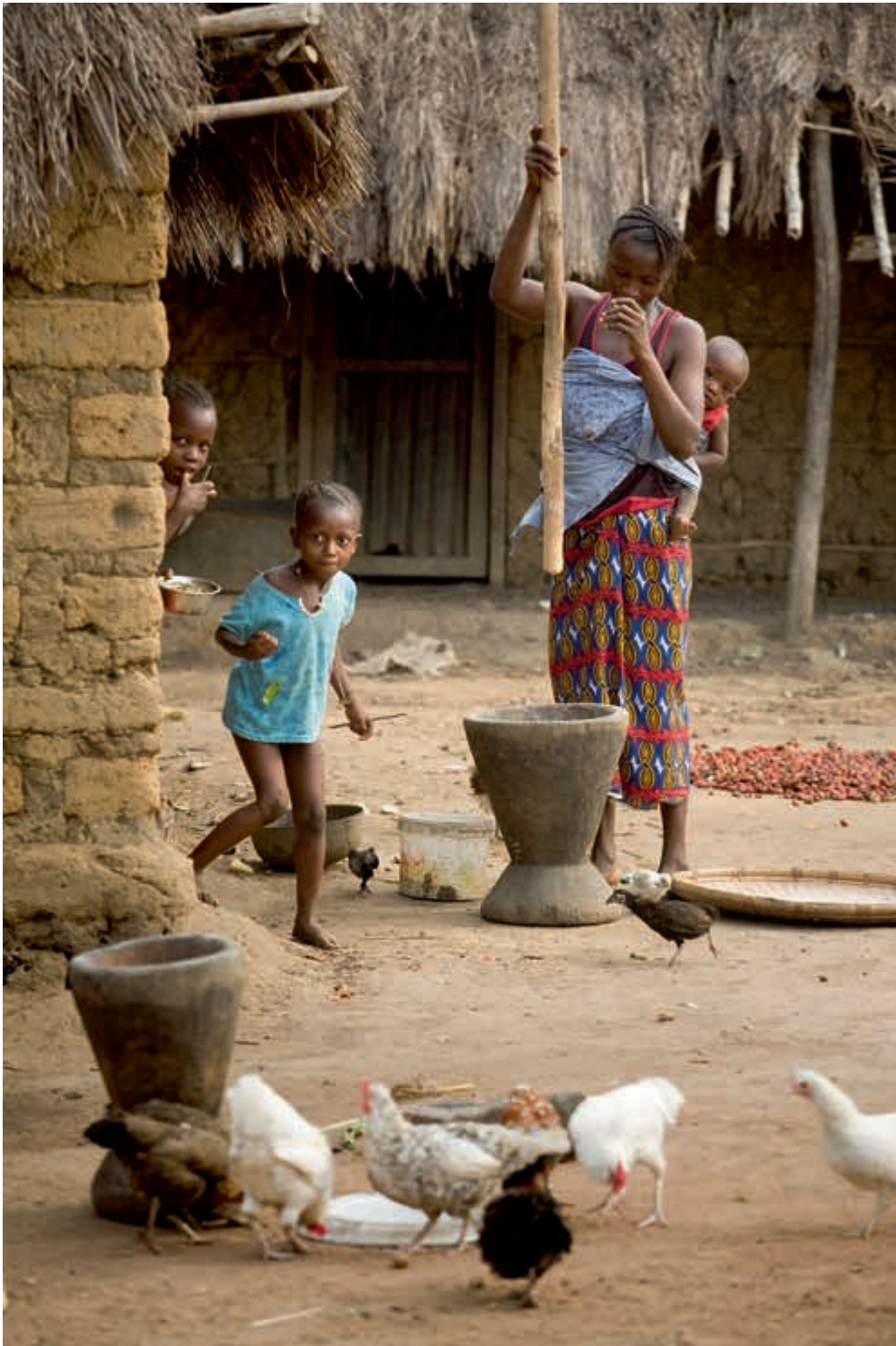
Nieuwsgierige kinderen op het erf van een woonhuis in Sierra Leone.