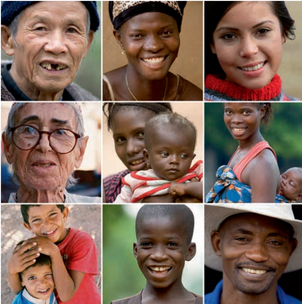
Mensen zijn overal anders. Mensen zijn overal hetzelfde.

Hoe u ook naar uw bestemming reist, het is van belang dat uw fotoapparatuur redelijk compact in één tas past. U hebt dan altijd direct zicht op uw kostbare en kwetsbare gereedschap. Bij een vlieg-, boot- of treinreis kunt u zo uw fototas ook altijd als handbagage meenemen. Daarmee voorkomt u vermissing, beschadiging en diefstal. Het is overigens toch niet onverstandig om de hoeveelheid camera's, lenzen en accessoires te beperken, omdat al dit materiaal in het veld al snel een geweldige last wordt. Het beknót de bewegingsvrijheid om bijzondere standpunten te kunnen kiezen én aan het einde van de dag zullen rug, schouders, nek en armen behoorlijk vermoeid zijn. In hoofdstuk 2 gaan we verder in op onder meer fototassen en -koffers en eventuele internationaal geaccepteerde sloten.