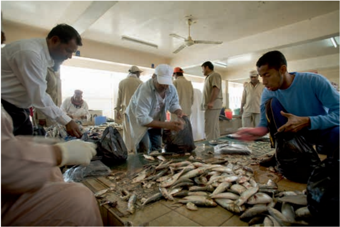
Vismarkt in Muscat, Oman.