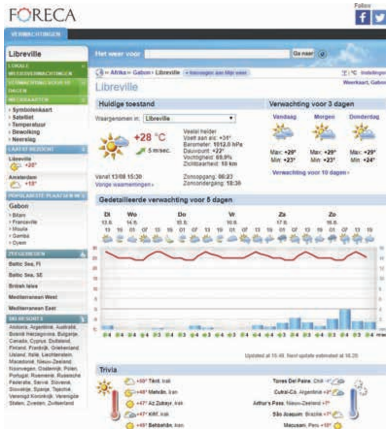
Het actuele weer in Libreville (Gabon) op 13 augustus 2019.